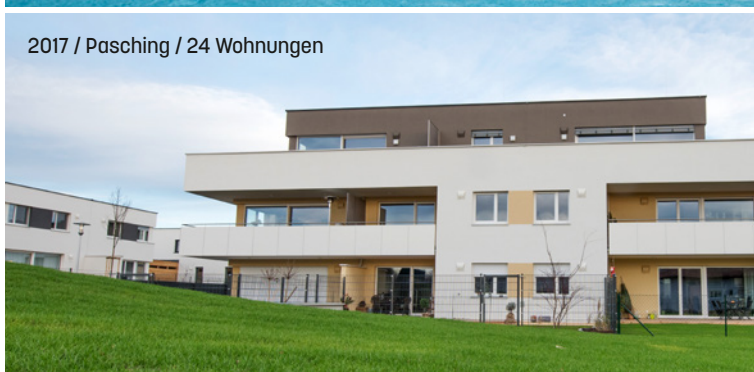
2017 / Pasching / 24 Wohnungen