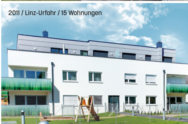
2011 / Linz-Urfahr / 15 Wohnungen