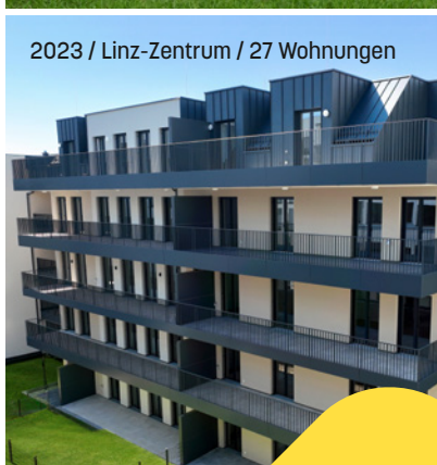
2023 / Linz-Zentrum / 27 Wohnungen