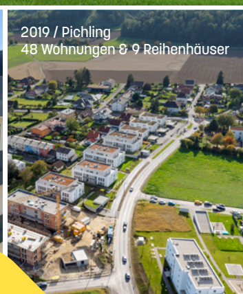
2019 / Pichling 48 Wohnungen & 9 Reihenhäuser