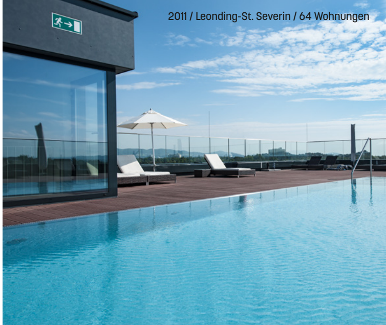
2011 / Leonding-St. Severin / 64 Wohnungen