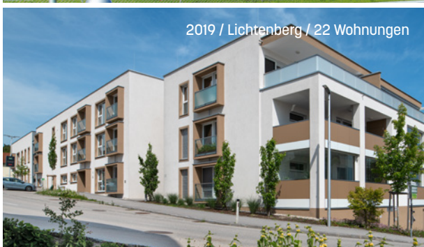
2019 / Lichtenberg / 22 Wohnungen