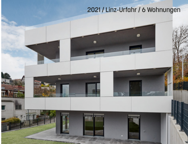
2021 / Linz-Urfahr / 6 Wohnungen